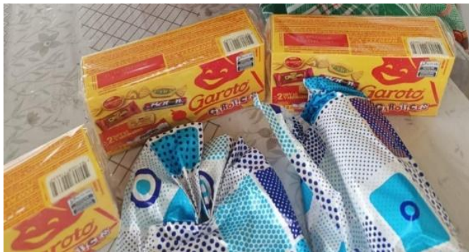
Figura 5. Brindes distribuídos durante as atividades educativas.