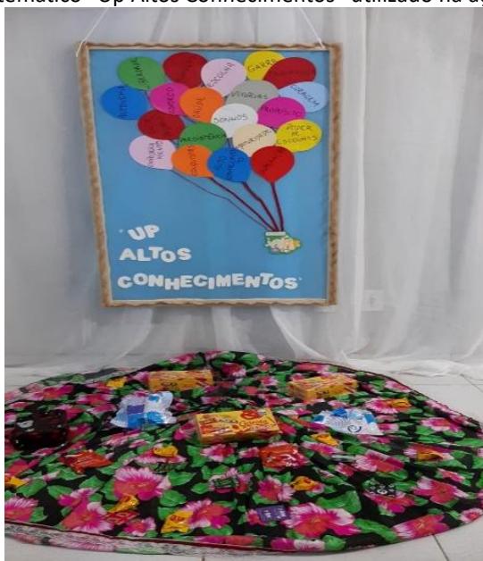
Figura 1. Painel temático “Up Altos Conhecimentos” utilizado na ação educativa.

No segundo processo circular, com o número aproximado de 9 participantes, discorreu-se sobre o tema Saúde sexual do adolescente, hábitos saudáveis e cuidados pessoais, com o auxílio de um painel temático (Figura 1). A abertura desse momento iniciou-se com quatro perguntas básicas: O que é adolescência? O que é autocuidado? O que é PCCU? Em suas respostas, os adolescentes definiram violência como “violência doméstica, sexual, psicológica e agressão”. Sobre autocuidado, responderam: “cuidar do corpo”, “aquilo que me deixa feliz” e “praticar esportes”. Quanto ao PCCU, houve ausência de definição, e não souberam responder.