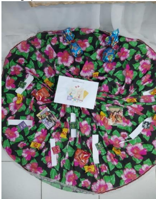
Figura 3. Dinâmica em grupo com cartões e brindes.

e palavras positivas de afirmação (Figura 3). Houve a participação de todos, em um momento leve e descontraído, no qual houve a exposição de pontos de vista particulares, e por fim, foi realizado um lanche coletivo (Figura 4) e o sorteio de brindes (Figura 5).