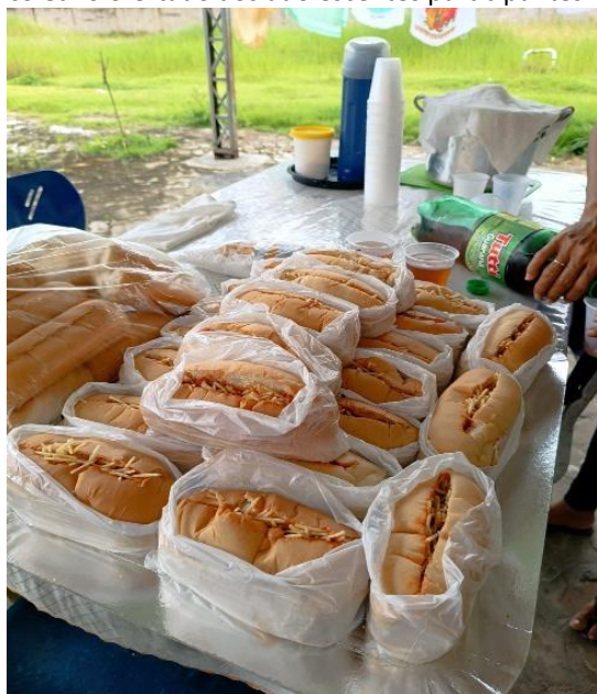
Figura 4. Lanche coletivo ofertado aos adolescentes participantes.